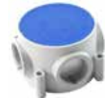
NY02 M25 X 1,5