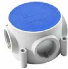
NY05 M50 X 1,5