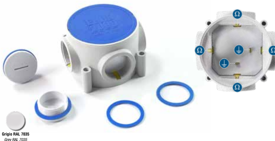
Grigio RAL 7035 Grey RAL 7035