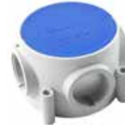
NY03 M32 X 1,5