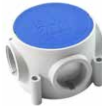
NY04 M40 X 1,5