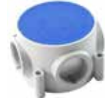
NY02 M25 X 1,5